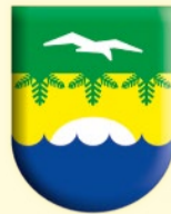
ГРАФИК ПРИЕМА ГРАЖДАН В ДЕКАБРЕ 2019 ГОДА

Глава муниципального образования – председатель Муниципального Совета города Зеленогорска