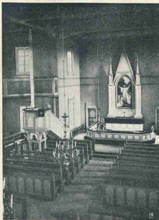
Kirkko nykyisessä asussaan.